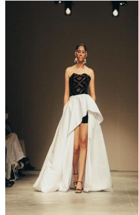
Pasarela Maestros Ancestrales Fashion Week Panama 2021